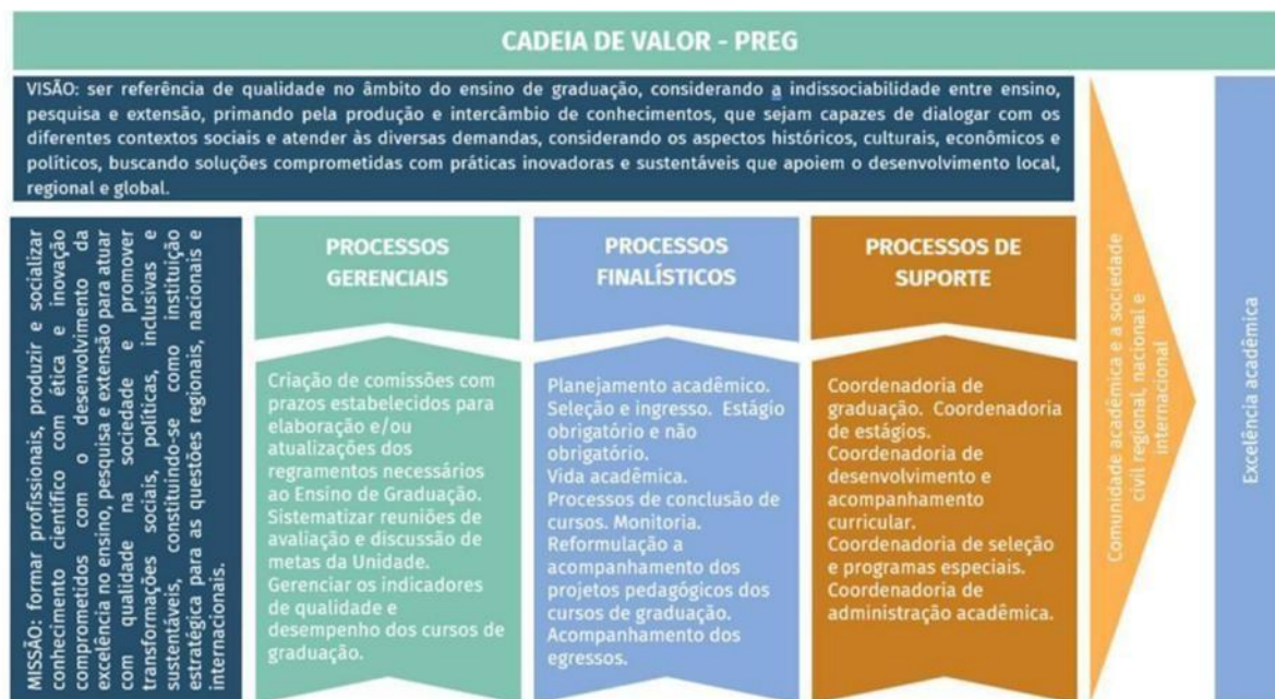
Figura 3: Cadeia de Valores da PREG